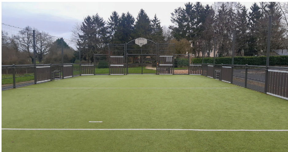
Photo 2 - City-stade de Vay inauguré en 2018

Élément d'attractivité, un axe routier relie la Communauté de communes aux villes de Nantes et de Rennes par la RN 137 qui va de Saint-Malo à Bordeaux. La portion