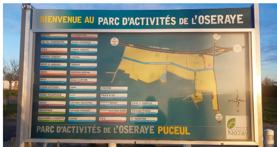
Photo 1 - Panneau d'affichage du parc d'activités de l'Oseraye

Le départ durable des populations urbaines ou périurbaines vers la campagne s'accroît depuis plusieurs années, ce qui transforme le profil de leurs habitants. Lieux de production agricole ou réservoirs de main d'œuvre des grandes villes, les petites communes situées en couronne des agglomérations peinent à rester dynamiques face aux territoires urbains bien plus denses et imposants en tous points. Le secteur agricole, certes majoritaire en termes d'espace, ne compense pas en termes d'apport économique, ni d'offres d'emploi. Ainsi les communes périurbaines sont souvent englobées dans les pôles urbains voisins. Or la Communauté de communes de Nozay refuse ces logiques tant vis-à-vis de Nantes Métropole que de Châteaubriant. Elle a ainsi mis en place une stratégie pour se développer en valorisant et en dynamisant son territoire sans pour autant devenir dépendante des métropoles qui l'entourent et en gardant son statut de ruralité.