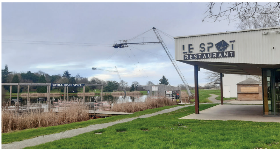
Photo 3 - Terrasse extérieure du restaurant « Le Spot » et système de traction du wake-board de Nozay